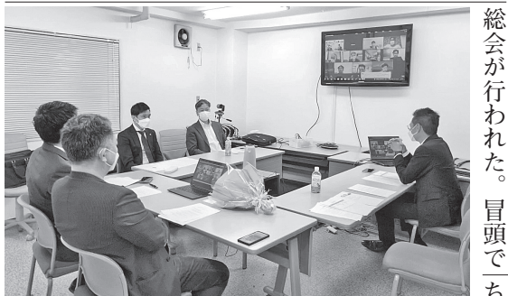
ハイブリッドでの総会開催

日本再生資源事業協同組合連合会青年部（以下日資連青年部）、関東資源回収組合連合会青年部（以下関資連青年部）は4月23日（土）に通常総会を開催した。日資連の本部とリモートでの開催となったが、本部に6名、リモートでも全国から多くの部員が集まった。東資協青年部からも5名が出席した。