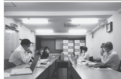
古紙センターヒアリング

9月15日、東資協本部会議室において公益財団法人古紙再生促進センターのヒアリングが実施されました。古紙再生促進センターでは2024年の創立50年の節目に向け古紙リサイクルの中長期的課題整理を進めており、関係企業・団体への聞き取り調査を実施しています。今回ヒアリングには、古紙再生促進センターの会長が出席しフリートールキング形式で意見交換が行われました。