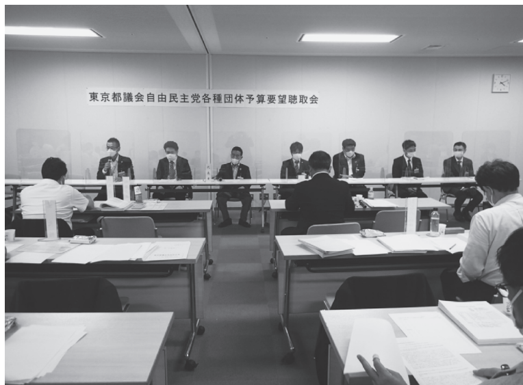
東京都予算等に対する要望書提出

安定的な資源リサイクルシステムの確立と集団回収業者に対する支援拡充の必要がある。